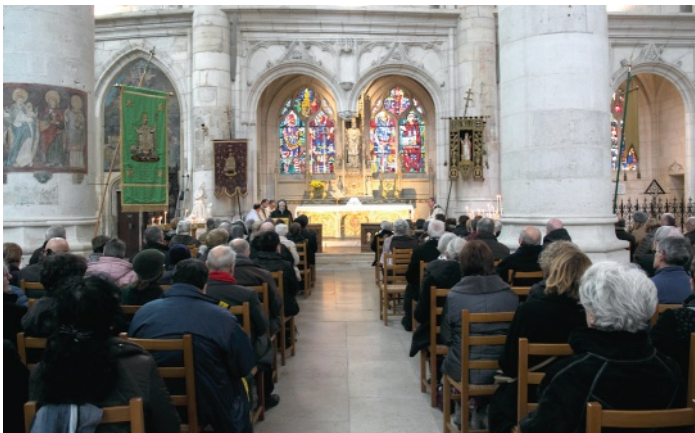
Messe célébrée devant l'autel Saint-Nicolas