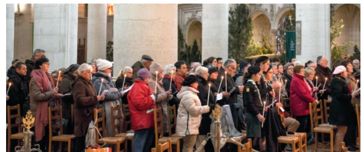
Cantique de Syméon : « Lumière qui éclaire les nations... »

Le mouvement Foi et Lumière en pèlerinage à Saint-Nicolas, accompagné de la communauté habituelle, des enfants se préparant à la première communion et des guides d'Europe (Nancy II), a participé à la messe solennisant la présentation de Jésus au temple, le 3 février. Les voix jeunes des guides ont chanté magnifiquement « Ne crains pas » le temps de l'offertoire.