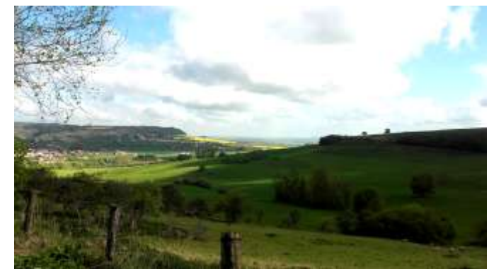
Autour d'Amance (54)

Ouverte à tous, jeudi 25 Mai 2017 de 10h à 18h