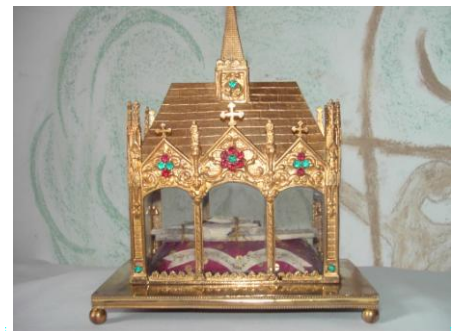
Le reliquaire renferme des reliques de deux martyrs.

Cette relique de Saint Gorgon est encore vénérée dans l'église de Varangéville ; elle est placée dans un petit reliquaire de bronze doré, à côté d'une relique de Saint Christophe, martyr lui aussi.